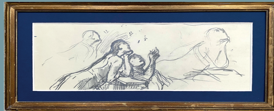
Étude pour Les Sages : le philosophe, l'orateur, le poète Esquisse pour la bibliothèque du conseil de Paris (Plafond) 1897 - Crayon noir 100 x 270 mm