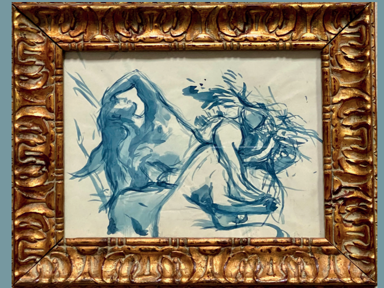
Étude pour L'Ambrosie Esquisse pour la salle à manger de l'Hôtel de Ville de Paris (Plafond) Entre 1891 et 1892 - Lavis d'encre bleue 195 x 150 mm