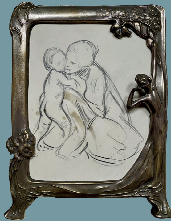
Étude pour le mois de Janvier Préparatoire au médaillon de l'Hôtel de Ville de Nancy 1891 - Crayon noir 120 x 55 mm

témoignent de sa maîtrise des techniques classiques et de son ouverture aux influences de son époque. L'ensemble de croquis proposés dans cette exposition révèlent son sens de l'observation de la nature, sa capacité à styliser les formes et son goût pour les lignes courbes et dynamiques. Tour à tour préparatoires à de grands décors (Hôtel de Ville de Paris et de Nancy), à des tableaux et à des objets d'art, Prouvé explore ici différentes techniques de dessin, allant du crayon à la plume en passant par le fusain et l'aquarelle. Ses feuilles se caractérisent par leur précision, leur finesse et leur sensibilité, variant entre différents styles allant du réalisme à l'abstraction, tout en conservant l'identité artistique de leur auteur. A collectionner pour soi ou à offrir, ses pétales graphiques ont été encadrés avec soin et volonté ornementale. Le Cloître de l'Art vous souhaite un éclatant Salon du Dessin 2025 !