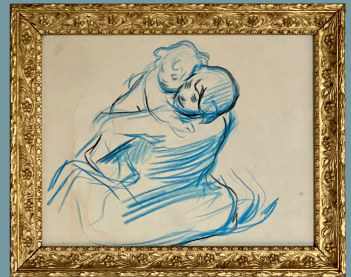
Étude pour la Maternité ou le Baiser après le bain Crayon de couleur bleu et noir 85 x 240 mm